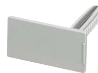
Marker tag holder